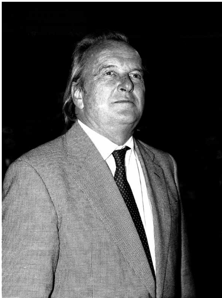
Francisco Pinto Balsemão, no Coliseu dos Recreios, em Lisboa, a 24 de março de 1995.